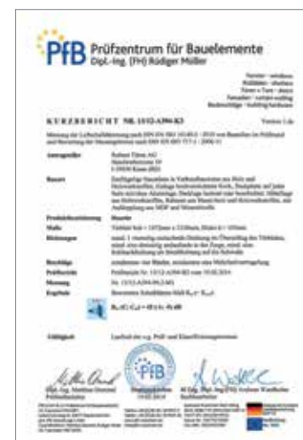
Gepüft und zertifiziert durch das PFB-Prüfzentrum für Bauelemente in Rosenheim